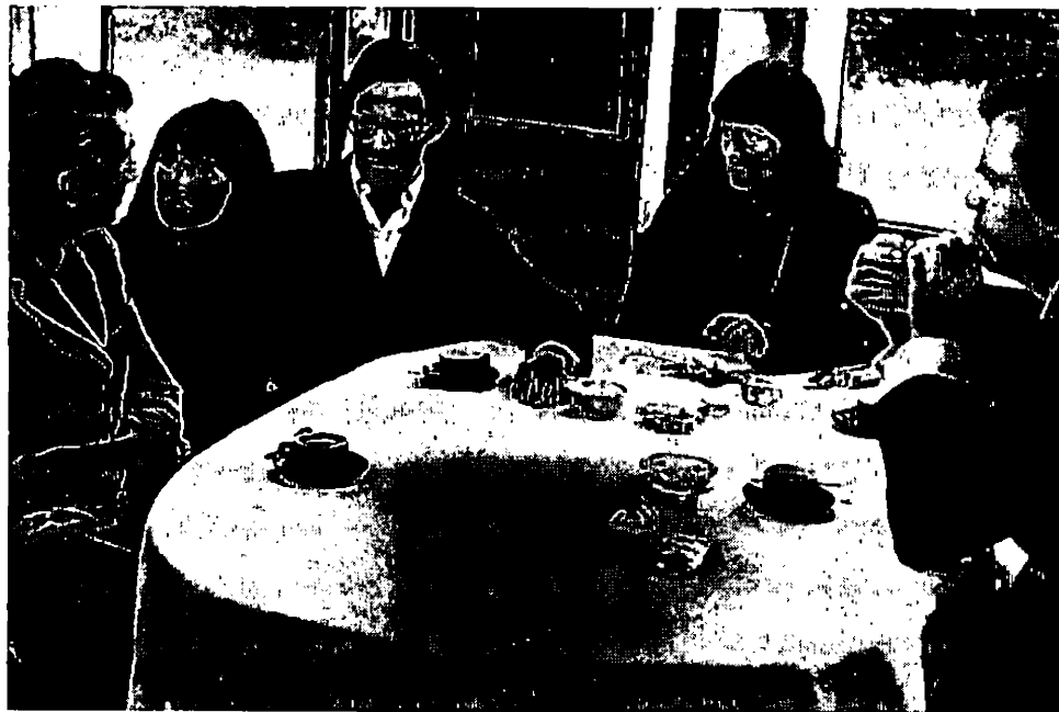
« Détruire dit-elle » : Daniel Gélin, Nicole Hlss, Henri Garcin, Catharina Sellers, Michel Lonsdale.